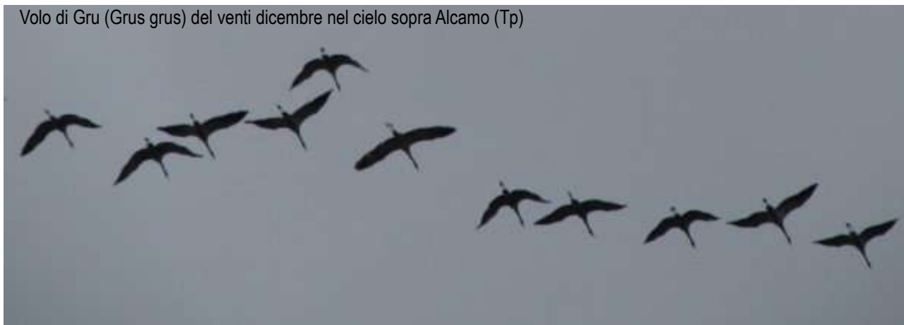
Volo di Gru (Grus grus) del venti dicembre nel cielo sopra Alcamo (Tp)

Artemisia coop. Per il turismo sostenibile e l'educazione ambientale Via Serradifalco, 119 Palermo 09166824488 3403380245 artemisianet@tin.it www.artemisianet.it